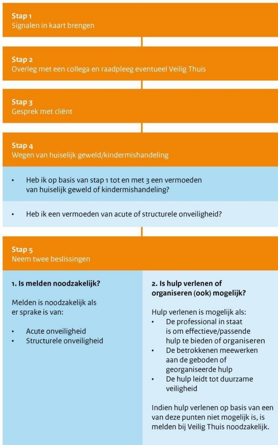
Figuur 1: Stappenplan verbeterde meldcode

De meldcode Huiselijk geweld en kindermishandeling helpt professionals bij vermoedens van huiselijk geweld of kindermishandeling. Aan de hand van 5 stappen bepalen professionals of ze een melding moeten doen bij Veilig Thuis en of er voldoende hulp kan worden ingezet.